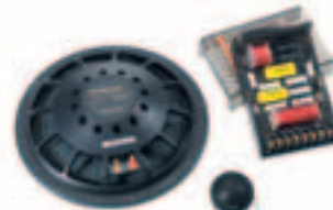
Hertz Space K8L: Sehr hochwertiges 20-cm-Kompo für den universellen Einbau.