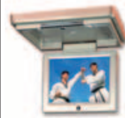
Blaupunkt IVMR-1042: Großes 10-Zoll-Display für echtes Kinovergnügen.