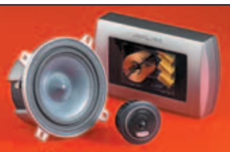
Alpine SPX-107 R: Erstes und einziges 10-cm-Kompo in der Absoluten Spitzenklasse.

Unsere Bestenliste listet alle seit dem Jahr 2003 von autohifi getesteten Geräte. Auch Modelle früherer Jahrgänge, die im Test besonders gut abgeschnitten haben, sind noch aufgeführt.