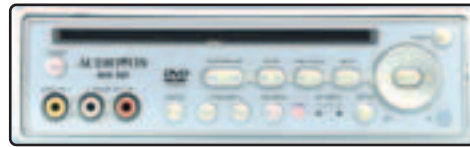
Audiovox AVD 201: Beste DVD-Player unter 300 Euro.